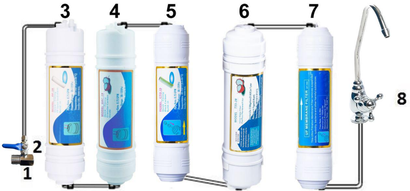
1. Trejgabals ventilim, 2. Ūdens pievada ventilis, 3. Mehāniskais filtrs, 4. Aktīvās ogles filtrs, 5. Jonu sveķu filtrs, 6. II. pakāpes ogles filtrs, 7. UF Membrāna, 8. Krāns